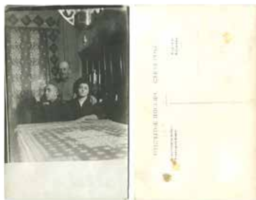
Рис. 1. Листівка із приватної колекції К. Мазуренка